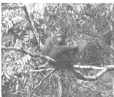
ボルネオ島のオランウータン