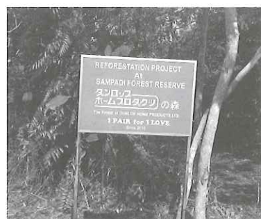
植林地に設置した看板

しになるかも知れませんが、ダンロップホームプロダクツの森にオランウータンが戻ってくることを夢見ております。今年も四ヘクタール、ダンロップホームプロダクツの森を拡大させていきます。