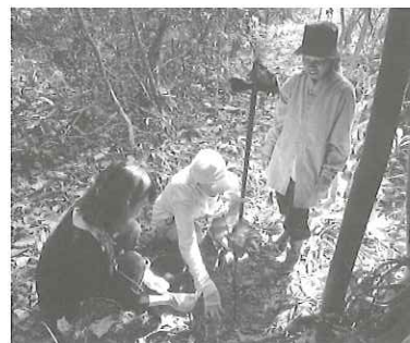
地域住民と共に植林作業

実際に二〇一〇年に自ら植樹した樹が二〇一二年に三メートルほどの高さになっていることを実感し、実現するのは未だ一〇年以上も先の話