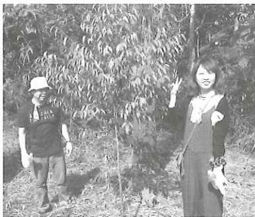
植林した木が順調に成長